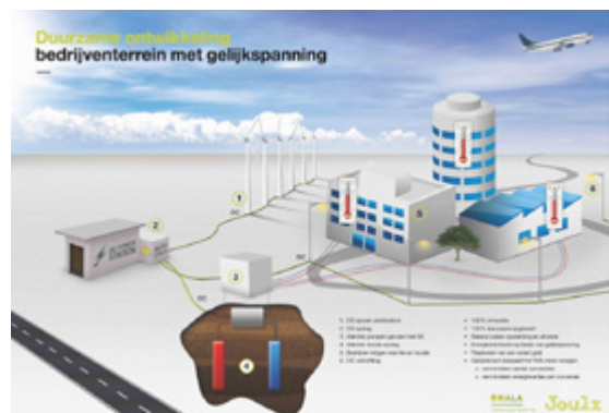
Foto 4: Vanwege de vaak grote dakoppervlakken lenen de gebouwen op bedrijventerreinen zich prima voor grootschalige PV-installaties.

Met alleen wisselspanning kunnen we de zware, kortstondige belastingen, zoals van elektrisch koken in een all-electric wijk, zonder aanpassingen niet gemakkelijk aan. Gaan we uit van de trias energetica in het all-electric tijdperk dan gaan we eerst de elektriciteitsvraag lokaal invullen met opgewekte en opgeslagen DC. Pas daarna vallen we voor de overige behoeften terug op het AC-net. Op die manier kunnen die twee heel goed samenleven in een gasloze woning of gebouw.