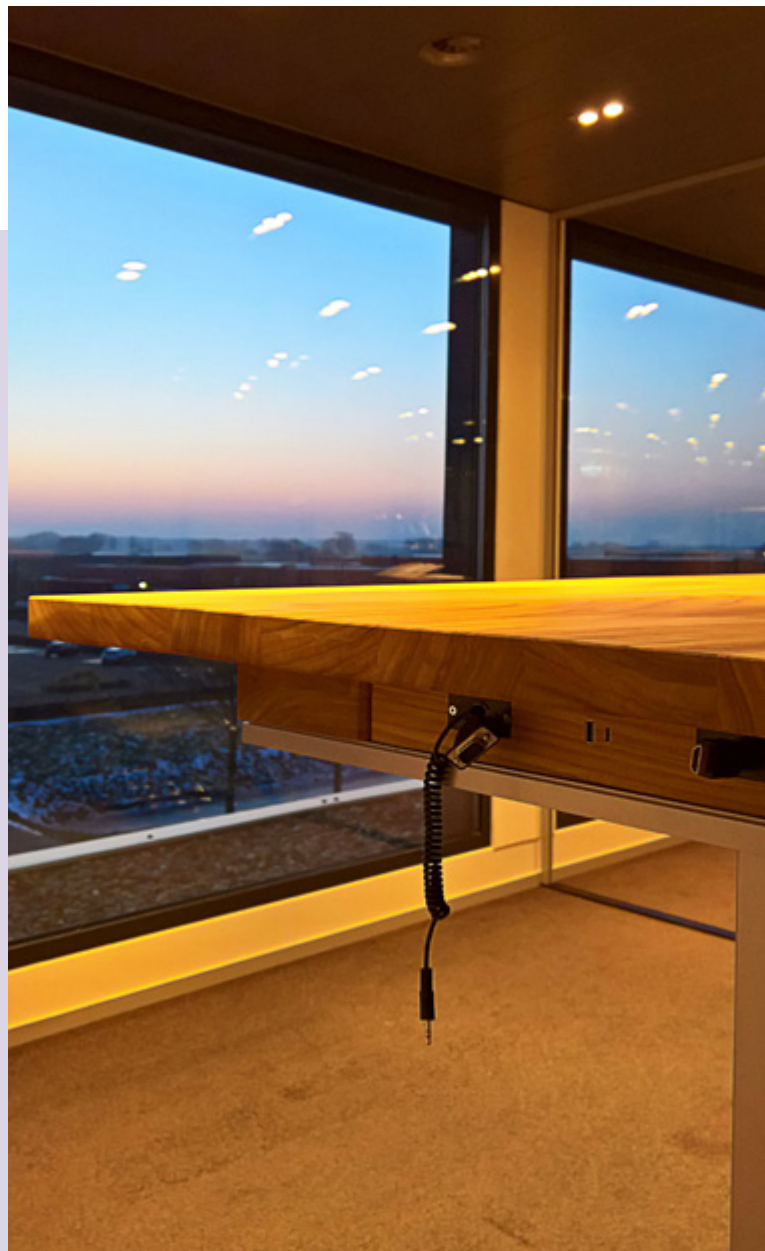
Foto 3: Een vergadertafel uit 2016 waarin zowel beeld, internet als voeding zijn geïntegreerd in één aansluiting, een modernere versie van de USB aansluiting: USB type C. Deze vergadertafel werkt zowel op gelijkspanning (DC) als op wisselspanning (AC).

Het Internet of Things (IoT) verbindt alle apparaten en installaties in de gebouwde omgeving met het internet. Het brengt verbondenheid, gemak en comfort. Gelijkspanning is voor het IoT een drager voor de communicatie en de aansturing, maar ook een communicatieprotocol. Met de sterke groei van IoT- en domotica-toepassingen, zal ook DC belangrijker worden.