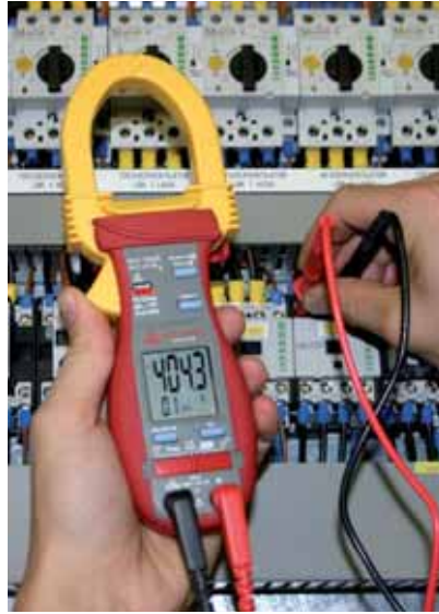
Metten aan de schakelkast