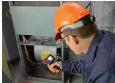
Metten is weten