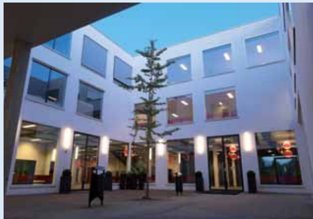
Insula College te Dordrecht (Omgevingsprijs VO).

Duidelijk te zien was, dat in bestaande scholen er aandacht is geweest voor slechte binnenmilieus. Bij minder dan een derde van de scholen was ongeregelde, natuurlijke ventilatie toegepast, met mechanische afzuiging. In alle andere gevallen was er sprake van vraaggestuurde ventilatie op basis van aanwezigheid en/of CO 2 of gebalanceerde ventilatie met warmteterugwinning. Wel waren er verschillende klachten bij gebalanceerde ventilatie, dat er te weinig verse lucht werd toegevoerd. Verschillende ventilatiesystemen waren uitgelegd op de minimumnormen. Anderen, in het bijzonder de v.o.-scholen, hadden de daadwerkelijke