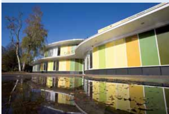
De Vlinder te Ter Apel (Omgevingsprijs PO).