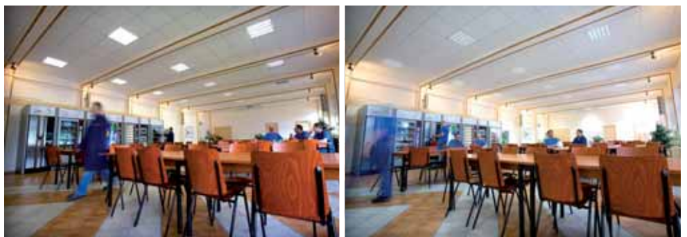
Overzicht beeld van de situatie na toepassing van LED-verlichting.