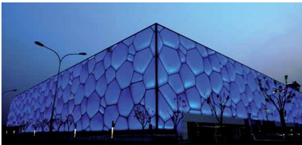
Icecube Olympische Spelen Beijing [2].

Ook als het materiaalgebruik wordt vergeleken, blijkt de LED-lamp een duurzaam alternatief, dat minder milieubelasting oplevert. Dit kan nog aanzienlijk verbeteren door minder aluminium te gebruiken, een optimalisatie die in het nieuwe ontwerp wordt opgenomen. Over de verwijderingsfase is wederom veel discussie. LED zal in de reguliere afvalstroom terechtkomen en in Nederland is dit product dan ook in principe volledig recyclebaar. De hoeveelheden fosfor en bijvoorbeeld arsenicum waarover wordt gesproken zijn zover bekend dermate gering dat ze niet schadelijk zijn. Voor klassieke verlichting zoals