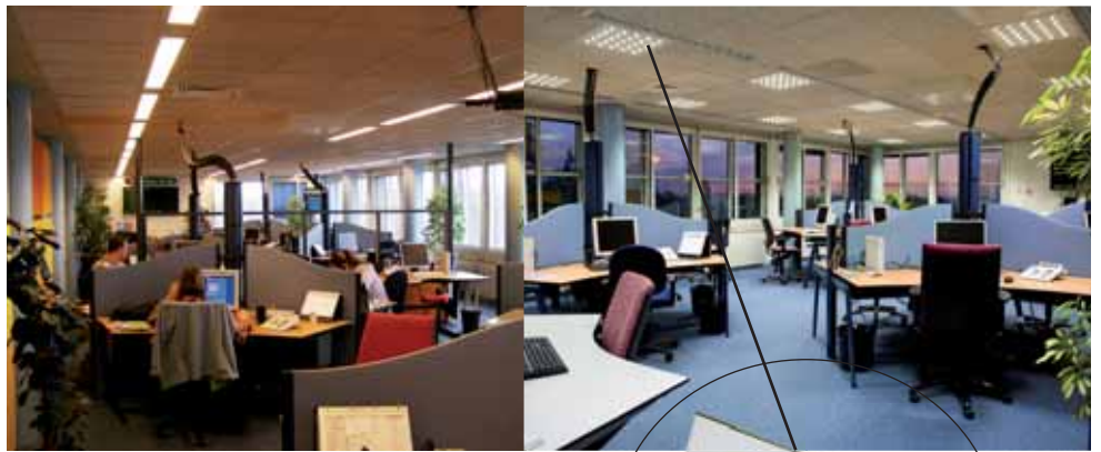
Vergelijk situatie kantoor voor en na plaatsing LED-verlichting.

Alle argumenten die momenteel worden aangevoerd om LED nog niet toe te passen zijn namelijk waar. Echter heeft LEDNED de afgelopen vier jaar zo intensief samengewerkt met kennisinstellingen zoals de TU/e, de KEMA, producent CREE, DIAL