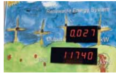
Opbrengstmeter pv-installatie [8].

Van groot belang is de koppeling van de resultaten in het onderwijs en te zorgen voor een directe betrokkenheid van de leerlingen met de opbrengst van de zonne-energie-installaties. Dit kan bijvoorbeeld worden bevoor-