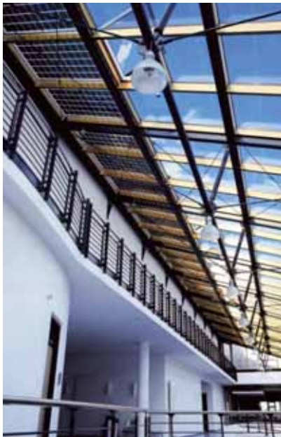
Centrale hal Fachhochschule Bonn-Rhein-Sieg.

Rembrandt College het meest energiezuinige schoolgebouw in Nederland realiseren. Het gebouw heeft 430 m 2 zonnecellen in twee kleuren: blauw en grijs. Een deel hiervan (ruim 70 m 2 ) is ondergebracht in zonwerende luifels boven de ramen van klaslokalen. De rest is opgenomen in de vliesgevel van het gebouw. De zonnepanelen zijn via 22 omvormers gekoppeld aan het elektriciteitsnet. Behalve de zonnepanelen is ook gebruik gemaakt van zonnecollectoren voor de verwarming