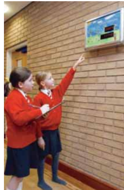
St Jerome's Catholic Primary School, Formby [8].