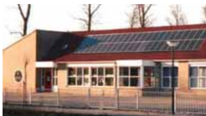
De zonnepanelen op de "Trije Doarpen Skoalle" van Reduzum [1].

N iet alleen gemeenten nemen initiatief, maar vaak ook particuliere stichtingen zoals de Schifting Doarpsmûne Reduzum. Deze stichting heeft als doelstelling, verbetering van het milieu, bevordering van energiebesparing en het gebruik van duurzame energie in de Friesse dorpen Reduzum, Idaerd en Friens. Dit heeft geresulteerd in de exploitatie van een 225 kW windmolen en 3 PV's installatie met een totaal vermogen van 13,2 kWp [1].