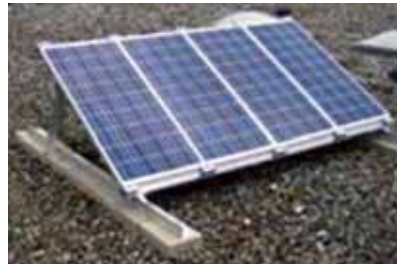
De platdakopstelling [9].