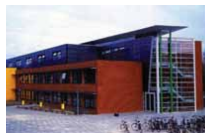
Rembrandt College te Veenendaal [4].

Het gemeentebestuur van Veenendaal wilde met de nieuwbouw van het