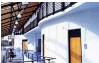
Centrale hal Fachhochschule Bonn-Rhein-Sieg.