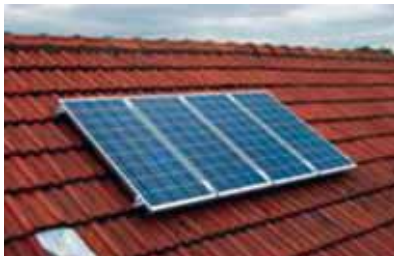
De pannendakmontage Vrije School Heerlen [9].

Zo is in oktober 2004 bijvoorbeeld in de gemeente Heerlen het project “zonne-energie voor scholen” geïnitieerd en is er begonnen met het installeren van pv-systemen op in totaal 42 scholen. Deze pv-systemen bestaan uit vier zonnepanelen in schuindak- of platdakopstelling, zie figuur 1 en 2, met een totaal vermogen van 320 Wp en een pv-opbrengstmeter [9]. Verder zijn er een speciale informatieve website en experimenten die met behulp van een ‘solar-experimenteerkit’, kunnen worden gedaan [9].