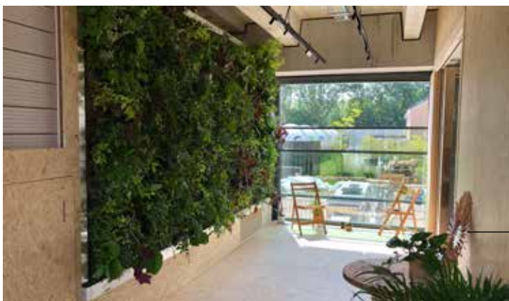
Foto 4: De wintertuin is ook van belang voor frisse lucht. De tuin is aan de binnenkant gerealiseerd om de lucht via de centrale binnenruimten te filteren is een groenwand bedacht.

Biomassa-positief zijn sluit hier nauw op aan. Türkcan: “De cirkel moet zo veel mogelijk worden gesloten in de toren zelf, dus veel biomassa, zoals afvalwater, maar ook gft- en het huis-tuin-en-keuken afval, wordt gecomposteerd om in de