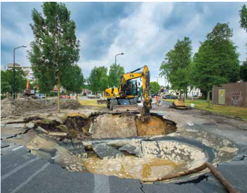
Een dicht netwerk van sensoren dat continu druk en volumestromen meet of er een onverkleerde verandering optreedt, kan helpen om lekverliezen te voorkomen.