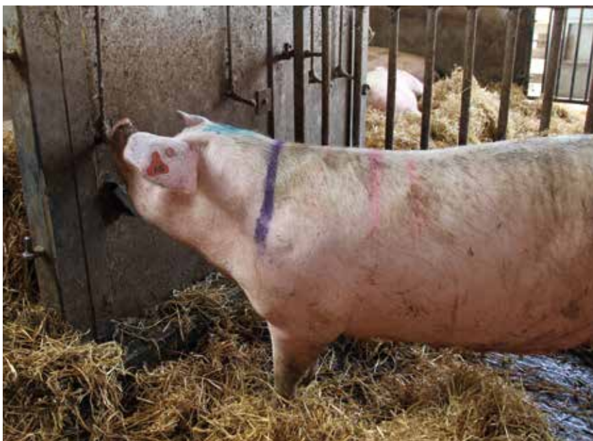
SIMDEUM is uit te breiden met de watervraag voor varkens, afhankelijk van hun leeftijd en voederpatroon.

In Nederland wordt bijna al het geprodu-