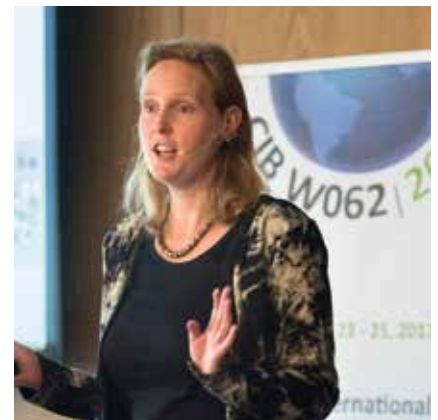
Dr. Mirjam Blokker (Nederland), keynotespreker van het symposium: 'Een betere voorspelling van de watervraag en een kleinere veiligheidsfactor geven het ontwerp een betere pasvorm voor de leidingwaterinstallatie.'

Pseudomonas. Gezondheidsrisico's ontstaan ook als het waterslot van stankafsluiters (in of aan sanitaire lozingstoestellen) wordt leeg