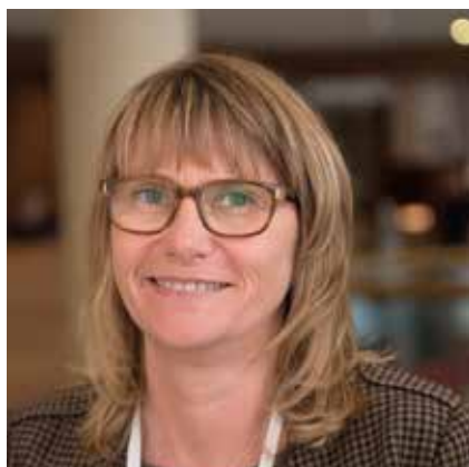
Prof. dr. Lynne Jack (Verenigd Koninkrijk) heeft een internationale benchmark laten uitvoeren naar bepalingmethoden voor de watervraag.

Staten de leidingdimensie wordt bepaald met behulp van de 'curve van Hunter'. Deze curve werd in 1940 ontwikkeld, gebaseerd op drie toestellen (badkraan, toilet en keukenkraan) zonder de gebruiksfrequentie mee te nemen. Hunters curve is tot op heden ongewijzigd gebleven. De richtlijnen waren op dat moment al conservatief, en in combinatie met veranderingen in de watervraag leidt ook het gebruik van deze methode tot overdimensionering. Dus ook in de VS wordt onderzoek gedaan naar een nieuwe aanpak. Blokker over het onderzoek in de VS: "Er zijn verschillende methoden getest om de piekvraag te berekenen en er is een grote dataset van metingen in de Verenigde Staten geanalyseerd. Als resultaat is een vraagvoorspelling ontwikkeld die de volgende zaken meeneemt: a) type tappunt, b) aantal tappunten, c) waarschijnlijkheid van het gebruik van het tappunt, en d) de volumestroom. De gebruiker kan a) en c) aanpassen. Deze ontwikkeling is onderdeel van een groter traject, waarbij in 2018 twee nieuwe Amerikaanse standaarden beschikbaar zullen komen: 1) Water Efficiency and Sanitation Standard (WE • Stand) en 2) Uniform Plumbing Code."