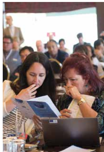
Delegatie van de Technical University of Košice (Slowakije).